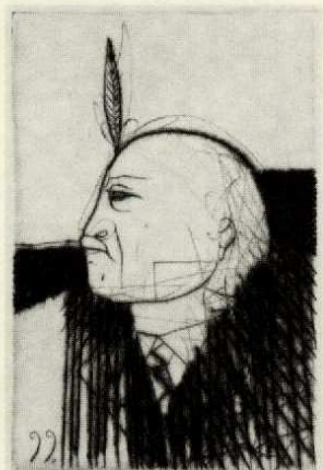
J | Selbst mit Feder