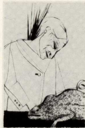
E | Selbst mit Chamäleon

Die Nummern I bis X, die die Luxusausgabe bilden, sind in zinnoberrotem Schafleder gebunden. Sie tragen auf dem vorderen Buchdeckel das Original eines Basreliefs von Paul Wunderlich in einer zum Einband abgestimmten Farbe und sind mit den vier eingebundenen, römisch numerierten und signierten Radierungen A (handkoloriert), I, J und K versehen. Zur Ausstattung gehört eine Kasette, die zusätzlich eine römisch numerierte und signierte Suite aller elf der Edition beigefügten Radierungen A bis K enthält und einen römisch numerierten und signierten Silbergelatineabzug einer Photographie von Karin Székessy.