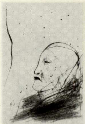
K | Selbst

Sämtliche Exemplare der Auflage sind von Paul Wunderlich und Fritz J. Raddatz handsigniert.