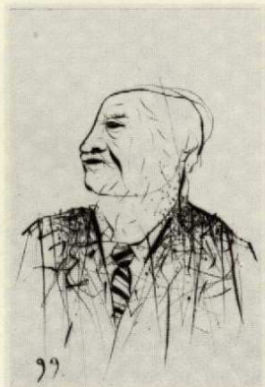
I | Selbst 99