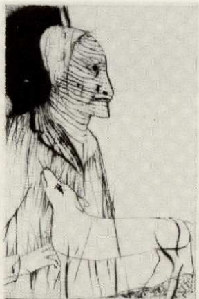
H | Selbst mit Hund