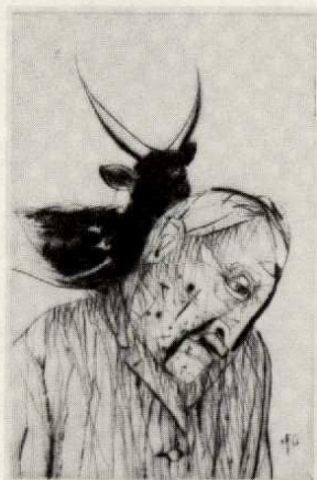
G | Selbst mit Stier